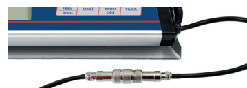
CONNETTORE PROFESSIONALE SCOLLEGABILE