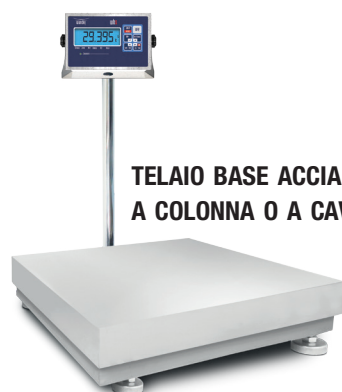
TELAIO BASE ACCIAIO INOX A COLONNA O A CAVO