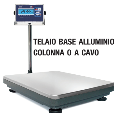
TELAIO BASE ALLUMINIO A COLONNA O A CAVO